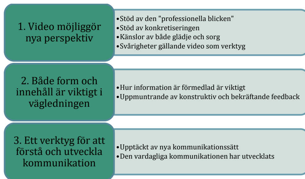
Figur 1. Huvudkategorier och underkategorier

Analysen av intervjuerna resulterade i tre huvudkategorier: Video möjliggör nya perspektiv , Både form och innehåll är viktigt i vägledning och Ett verktyg för att förstå och utveckla kommunikation (Figur 1). Varje huvudkategori har tillhörande underkategorier. 3