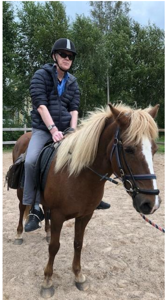
Bildbeskrivning: Bild 1. Tolv deltagare och tolkar sitter i en stor gul kanot, invid en brygga . Det är skog runtomkring och alla deltagaran håller upp sina paddlar i luften och ser glada ut. Bild 2. En deltagare, med solglasögon och svart hjälm, sitter på en brun islandshäst med ljus man.